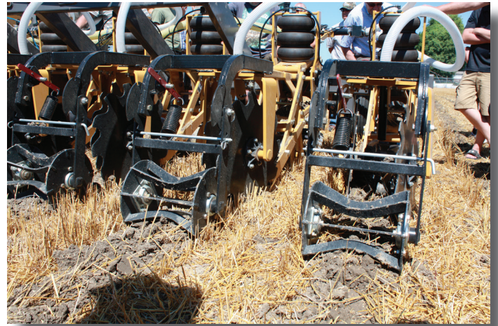
Figura 3. Inovação e adaptação regulares são necessárias para garantir que as práticas conservacionistas complementem e aprimorem os sistemas de manejo existentes. Este implemento foi projetado para aplicar o fósforo em faixas sob a superfície do solo; neste caso, sob a palhada de trigo de inverno, no outono.

contínuo das práticas conservacionistas (Figura 3), de modo que a gestão adaptativa é quase universalmente necessária (KLEINMAN et al.; 2015).