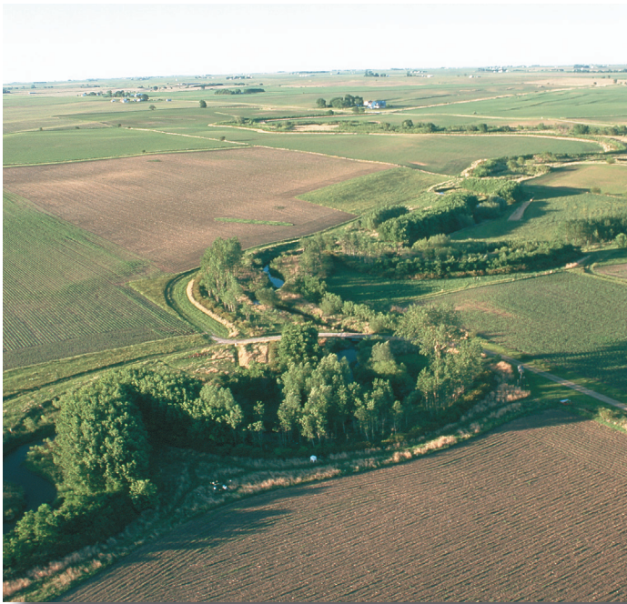
Figura 2. Cordões de vegetação e de gramados ribeirinhos podem, em muitas situações, interceptar o fósforo no escoamento superficial e ajudar a estabilizar os riachos.

lado, mas o acúmulo de P do adubo, do estrume e da vegetação na superfície do solo cultivado em sistema conservacionista pode levar a um aumento das perdas de P dissolvido (SHARPLEY; SMITH, 1994; TIESSEN et al., 2010).