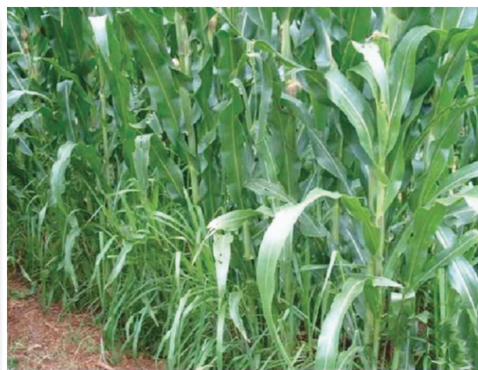
Figura 2. Consórcio de milho com Brachiaria brizantha .