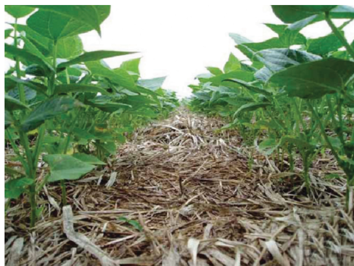
Figura 1. Cultura de feijoeiro sob plantio direto realizado corretamente. Observe as quantidades favoráveis de resíduos das culturas anteriores na superfície do solo.

Fontes: 1 Farina e Channon (1988); 2 Sousa e Ritchey (1986); 3 Pavan e Bingham (1986); 4 Sumner e Carter (1988).